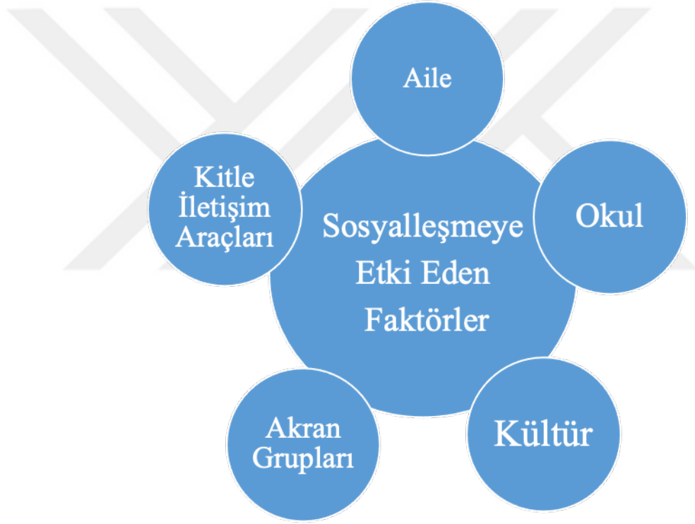
Şekil 2.1: Sosyalleşmeye etki eden faktörler.

Sosyalleşmeye etki eden başlıca faktörler aşağıda yer alan şekilde gösterilmektedir.